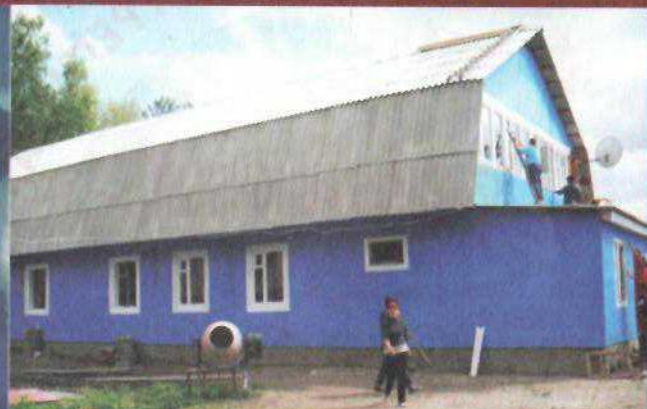
Добро, отзывчивость, сострадание - это верх человеческого достоинства