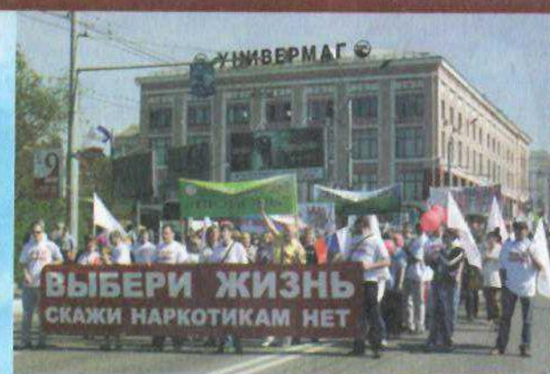
Человек, делающий счастливыми других, сам не может быть несчастным